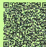
医療技術職員・行政職員 採用選考申込フォーム