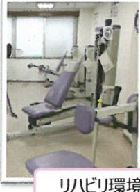
リハビリ環境が充実