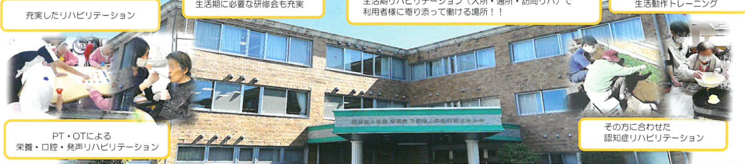
PT・OTによる栄養・口腔・発声リハビリテーション