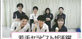
若手セラピストが活躍