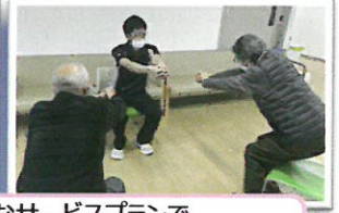
豊富なサービスプランで 一人一人にあったリハビリを！